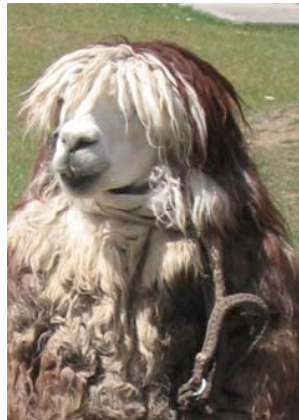
Aus der feinen Wolle der Alpaka wird feine Mode gestrickt.

Besondere Geschenke , die es nicht überall gibt – aus Fairem Handel: z.B. Taschen aus Naturleder oder Recyclingmaterialien, schicke Mode aus Alpaka, handgearbeiteter Schmuck, Seidentücher, Schokolade in vielen Variationen, Weihnachtsschmuck, Klangschalen u.v.m.